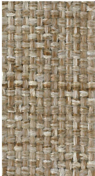
AM37 Beige Heather

Seating / Soft Seating / Tackboards Sièges / Mobilier rembourré / Babillards