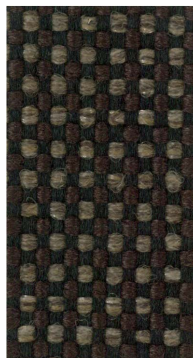
AM60 Black & Tan