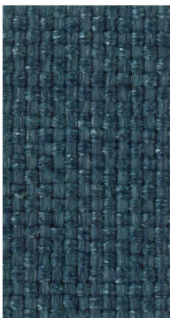
AM45 Blue Heather