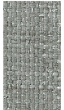
AM46 Light Grey