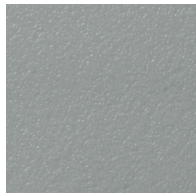
P02 - Gris