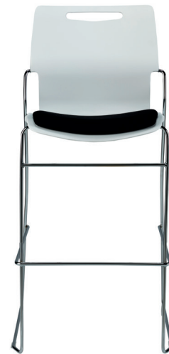
PL31H Tabouret hauteur table à bistro/café