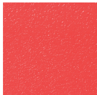
P04 - Rouge