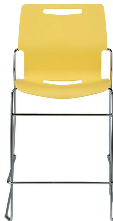
PL31CR Tabouret hauteur comptoir