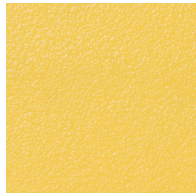
P06 - Jaune