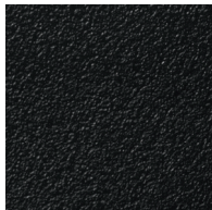
P01 - Noir