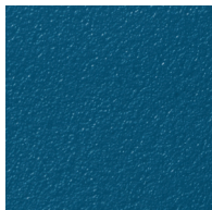
P03 - Bleu