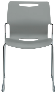
PL01 Chaise visiteur